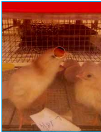
Merlino e Morgana: i pulcini nati all'asilo nido!

animali devono essere specificatamente autorizzati e vigilati. Il Regolamento ribadisce anche che la corretta convivenza tra animali e uomini implica da parte di tutti i possessori di un animale domestico un supplemento di rispetto e senso civico, per evitare che chi non può o desidera possedere un animale debba subire disagi e disturbi. Sono quindi introdotti alcuni limiti, ad esempio per i detentori di cani: in una abitazione possono essere di norma