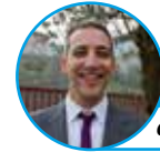
di Igor Marcolongo

“Che bella la Festa della Mira! Peccato che dopo questi tre giorni non ci siano iniziative fino a settembre, proprio d'estate, quando la gente avrebbe più voglia di uscire...”