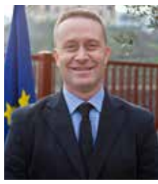
Il Sindaco Filippo Legnaro

Non una semplice festa quindi, ma un momento di incontro per maturare sempre più quel senso di appartenenza che ci unisce e ci rende più solidali. Un progetto di crescita prevede anche la disponibilità ad anteporre le esigenze della Comunità a quelle personali e al rispetto delle regole che a volte infastidiscono e sembrano limitare la libertà di ognuno ma che in realtà arricchiscono lo stare bene insieme. Torreglia deve riscoprire nel senso civico e nella partecipazione alla vita del paese la propria linfa vitale, a partire da quei giovani nati nel 1987, nuovi diciottenni, ai quali il prossimo 2 giugno in occasione della Festa della Repubblica consegneremo a nome di tutta la cittadinanza una copia della Costituzione Italiana per dare loro fiducia e responsabilizzarli al progetto di crescita della nostra Comunità.