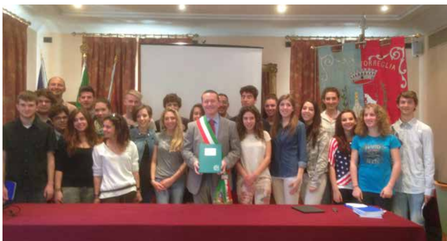
Foto: Consegna della Costituzione alla classe 1996 - 2 giugno 2014

Repubblica martedì 2 giugno alle ore 10.30 presso la Sala Corinaldi dell'Hotel La Torre.